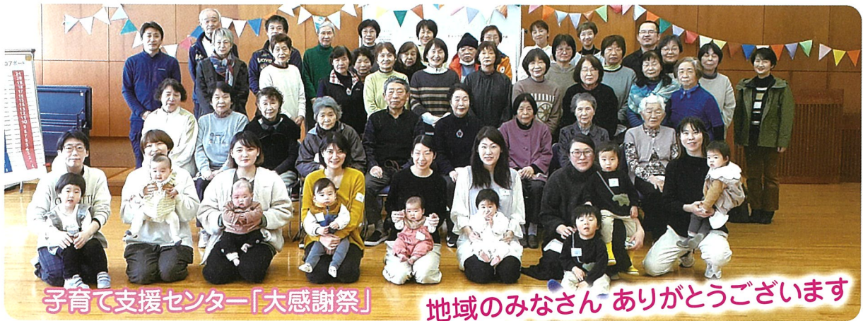
子育て支援センター「大感謝祭」